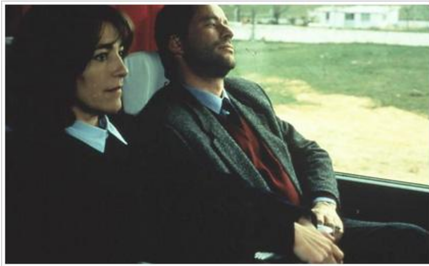
Sombras de una batalla (1993).

casa de Bernarda Alba ), auténticos ejercicios de estilo que revelan las potencialidades del lenguaje cinematográfico en la traslación de los textos teatrales de Lope de Vega y Federico García Lorca, hay otros relatos basados en narraciones que constituyen, al mismo tiempo, una visión de la sociedad de una época, como es el caso de Young Sánchez y La colmena , novela de referencia de la literatura de posguerra y auténtica obra cinematográfica premiada en el Festival de Berlín. El ciclo es una buena ocasión para volver sobre Sombras en una batalla , a mi juicio una de las mejores y más desconocidas películas del cineasta, además de valiente denuncia de las violencias que genera el terrorismo, y que tiene su revalidación en La playa de los galgos . En ésta, al hilo de la historia de la esposa de un ingeniero secuestrado y asesinado por ETA se pone en pie toda una dramaturgia de innegable sabor shakespeariano que constituye, al mismo tiempo, una reflexión en profundidad sobre temas tan universales como la venganza, el perdón y la posibilidad de un amor superador de cualquier rencor. Muy próximas a la biografía del director y a la historia y al presente de Cantabria –y rodadas ambas en la región– son los dos títulos que cierran el ciclo: Los días del pasado y El color de las nubes , filmes muy directos, poseídos por el placer de narrar y un halo poético que gratifican al espectador en todo momento, al tiempo que le plantean interrogantes.