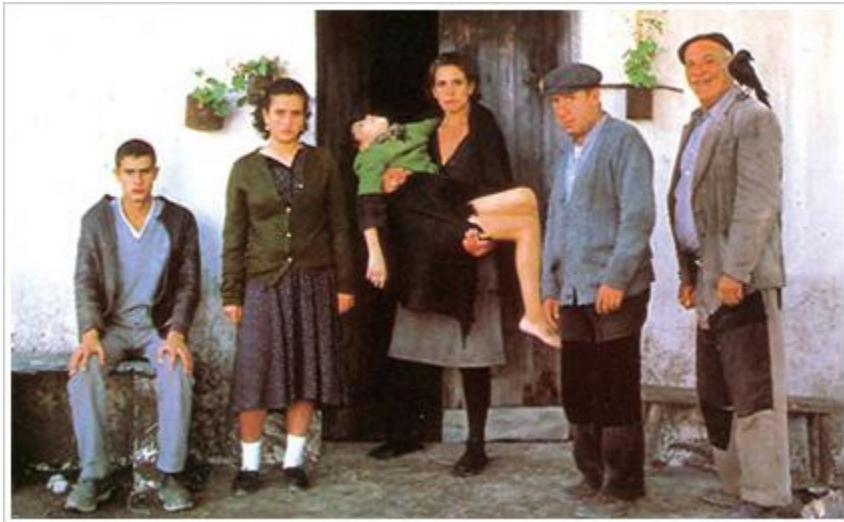
Los santos inocentes (1984).

Como anticipo a la entrega del Goya de Honor, la Academia de Cine ha programado en su sede un ciclo de obras representativas de Mario Camus: concretamente, se proyectarán los dos capítulos iniciales de La forja de un rebelde , magnífico fresco de las primeras décadas del siglo XX de la historia de España vista a través de la novela autobiográfica de Arturo Barea y siete películas de distintos momentos de su carrera. Junto a cintas que muestran la reconocida capacidad de Camus para las adaptaciones literarias al cine ( La leyenda del alcalde de Zalamea , La